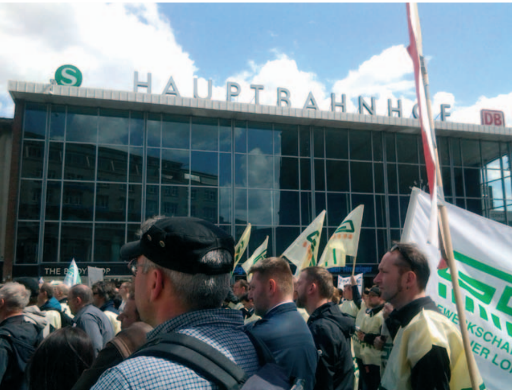
Zwei Fotos aus dem letzten großen Arbeitskampf der GDL 2014/2015: Kundgebung von GDL-Mitgliedern vor dem Kölner Hauptbahnhof (oben) und eine der vielen Solidaritätsaktionen von Bahn-Nutzenden – für die kommenden Wochen sehr zur Nachahmung empfohlen

Zur motivierten Mitarbeit gehört auch eine angemessene Bezahlung, die die besonderen Umstände des Personaleinsatzes mit vielen Überstunden, Schichtdiensten und oft unvorhergesehenen Personaleinsätzen „fern der Heimat“ berücksichtigt. Da sind die LokführerInnen in einer ganz besonderen Rolle, weil man sie normalerweise ebenso wenig bei der Arbeit sieht wie das Stellwerkpersonal. Doch der ganze Bahnbetrieb hängt von ihrer wichtigen Arbeit ab. Und Wertschätzung sollte sich am Ende auch in angemessener Bezahlung ausdrücken. Damit „BahnerIn“ wieder ein wichtiger Zukunftsjob wird. Also müssen sich der DB-Vorstand und die Vorstände aller anderen Bahnunternehmen und die politisch verantwortlichen Eigentümer zu einer klimarettenden Strategie mit einer motivierenden Personalpolitik und expansiven Infrastrukturpolitik bekennen, und ebenso zu einer angemessenen beschäftigungsfreundlichen, zukunftssichernden Tarifpolitik. Die durch eine angemessenes Tarifangebot Streiks abwendet, statt stur in die Konfrontation zu verhandeln.