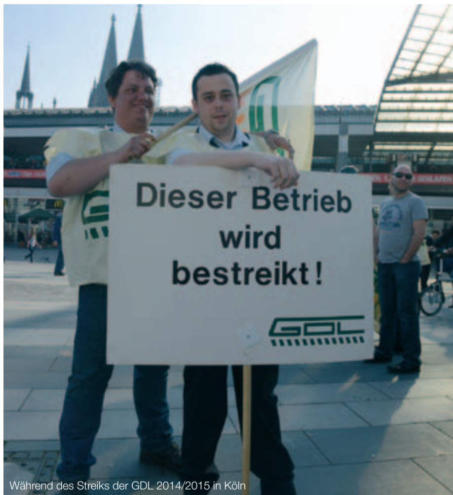
Während des Streiks der GDL 2014/2015 in Köln

Deutschen Bahn, von den Unternehmerverbänden und von einem großen Teil der Medien mit einer wahren Hasskampagne überzogen worden. Positive Beispiele, dass kämpfen sich lohnt, darf es nicht geben. Wenn Arbeitskämpfe, wie der der GDL 2014/15, erfolgreich sind, dann wirkt das beispielhaft für die gesamte Gewerkschaftsbewegung. Deshalb soll jetzt an der GDL ein Exempel statuiert werden.